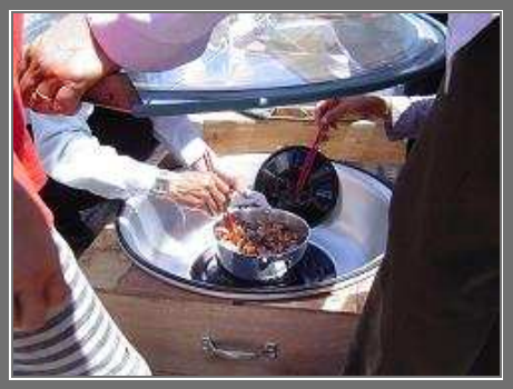
Lúc mở nắp bếp NLMT Đàn ông cũng tích cực tham gia nấu nướng Thử xem thức ăn đã chín chưa nào?