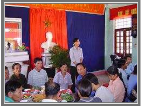
Đại diện Hội Phụ nữ phát biểu cảm ơn