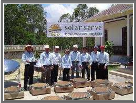
Đội ngũ nhân viên - 10 chiếc bếp hình parabol và 50 chiếc bếp hình vuông Tờ giấy bốc cháy trong 30 giây