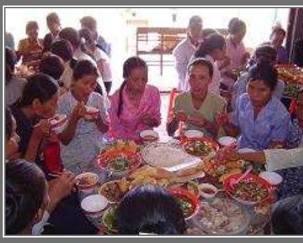
Lần đầu tiên được thưởng thức món ăn