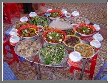
Những món ăn NLMT