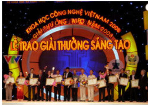
Tám nhóm tác giả nhận giải nhì.

NDĐT – Lễ trao giải thưởng Sáng tạo KH-CN Việt Nam (VIFOTEC 2008) vừa diễn ra tối nay, 15-4 tại Nhà hát Lớn Hà Nội. 35 công trình, trong đó có hai giải nhất, tám giải nhì, 12 giải ba và 13 giải khuyến khích đã được vinh danh tại lễ trao giải.