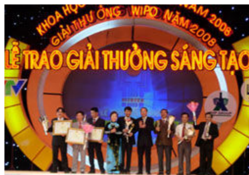
Phó Chủ tịch nước Nguyễn Thị Doan và ông Tô Huy Rứa trao giải nhất cho hai nhóm tác giả.

Một là, trong điều kiện chúng ta đang tích cực và chủ động thúc đẩy tiến trình hội nhập kinh tế quốc tế hiện nay, bài toán công nghệ rất cần hướng mạnh vào việc nâng cao chất lượng, hàm lượng trí tuệ và tính cạnh tranh của sản phẩm.