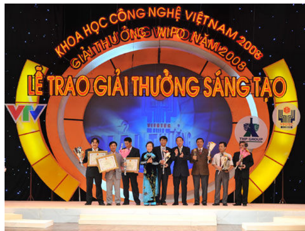
Phó chủ tịch nước Nguyễn Thị Doan và Trưởng ban tuyên giáo Trung Ương Tô Huy Rúa trao giải nhất cho các tác giả.

Tối qua, Quỹ Hỗ trợ Sáng tạo Kỹ thuật Việt Nam và Bộ KH-CN, tổ chức trao giải cho tác giả của 35 công trình đạt giải thưởng Vifotec năm 2008. Tại Nhà hát lớn Hà Nội, Quỹ Hỗ trợ Sáng tạo Kỹ thuật Việt Nam (Vifotec), thuộc Liên hiệp các Hội KHKT Việt Nam (VUSTA) và Bộ KH-CN, tổ chức lễ trao giải thưởng Vifotec năm 2008. Phó Thủ tướng Chính phủ Nguyễn Thiện Nhân, Phó Chủ tịch nước Nguyễn Thị Doan, Trưởng Ban tuyên giáo Trung ương Tô Huy Rúa cùng lãnh đạo các bộ, ngành, các nhà khoa học đã đến dự lễ trao giải.