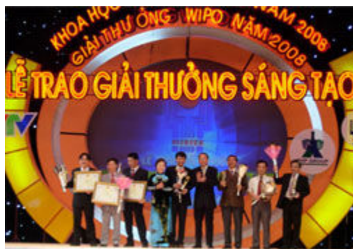
Phó Chủ tịch nước Nguyễn Thị Doan và ông Tô Huy Rứa trao giải nhất cho hai nhóm tác giả.

Một là, trong điều kiện chúng ta đang tích cực và chủ động thúc đẩy tiến trình hội nhập kinh tế quốc tế hiện nay, bài toán công nghệ rất cần hướng mạnh vào việc nâng cao chất lượng, hàm lượng trí tuệ và tính cạnh tranh của sản phẩm.